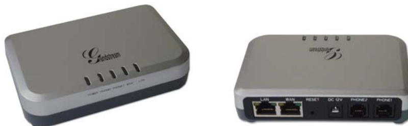
Handytone 502 & HandyTone 503

Numéro de pièce: 418-02010-10 Version du document: 1.0