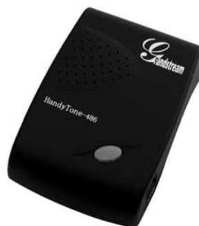
HandyTone 286 & HandyTone 486

Grandstream Networks, Inc., 126 Brookline Avenue -3 rd Floor, Boston, MA 02215 USA Tel: (617) 566-9300, FAX: (617) 249-1987 www.grandstream.com Dernière mise à jour le 10/10/2008